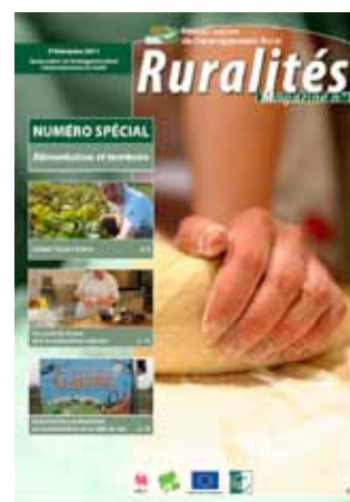
Alimentation et territoire - Sept. 2011