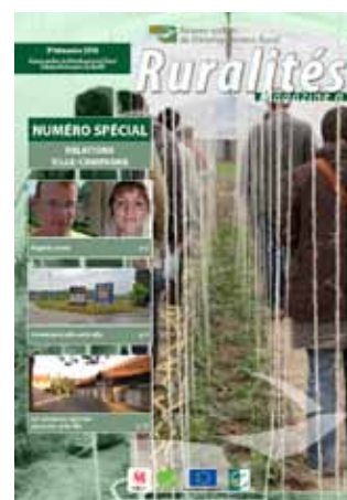
Relations ville - campagne - Sept. 2010