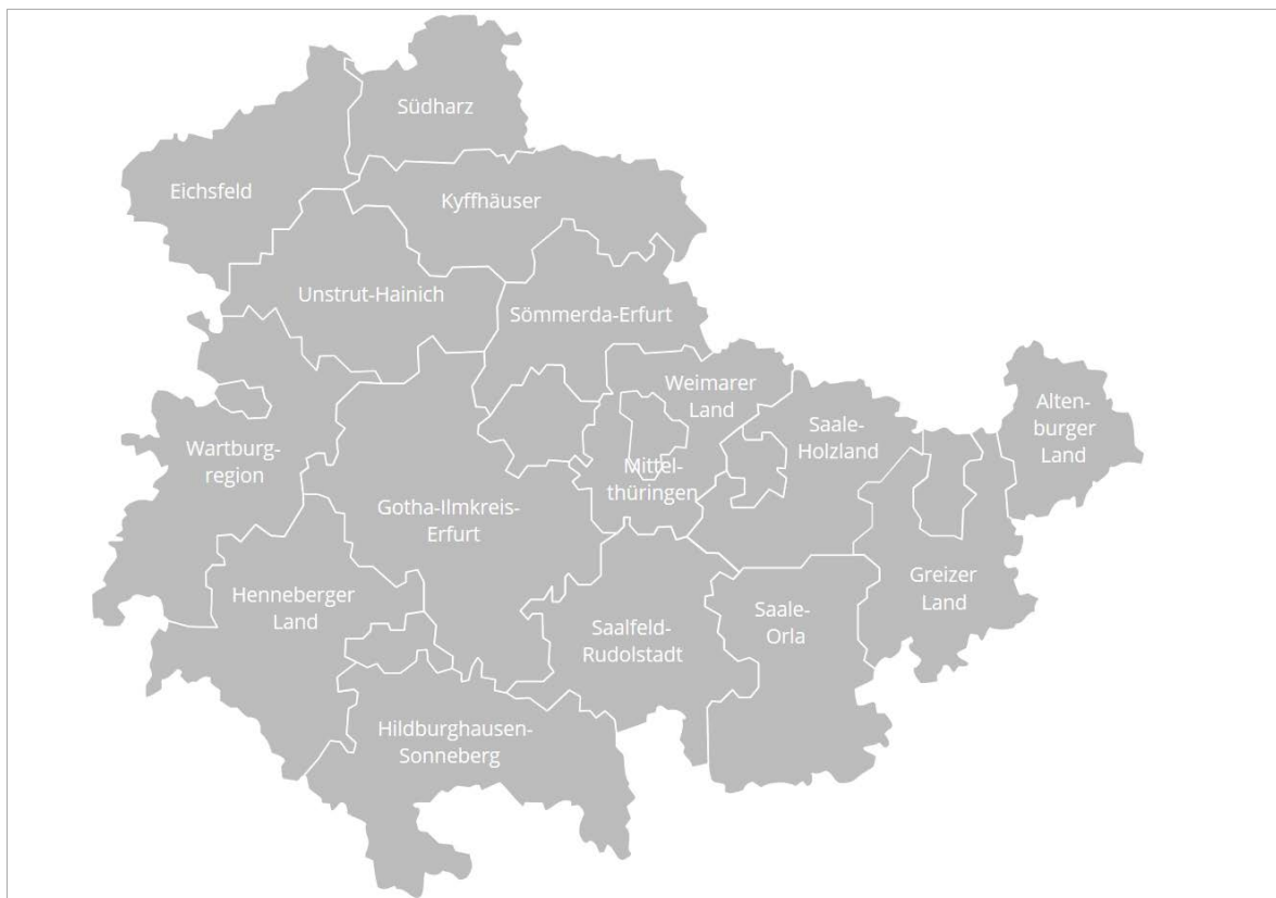
Abbildung 1: Die 15 LEADER-Regionen Thüringens in der Förderperiode 2014 bis 2020

Quelle: http://www.leader-thuering.de , abgerufen am 07.09.2017