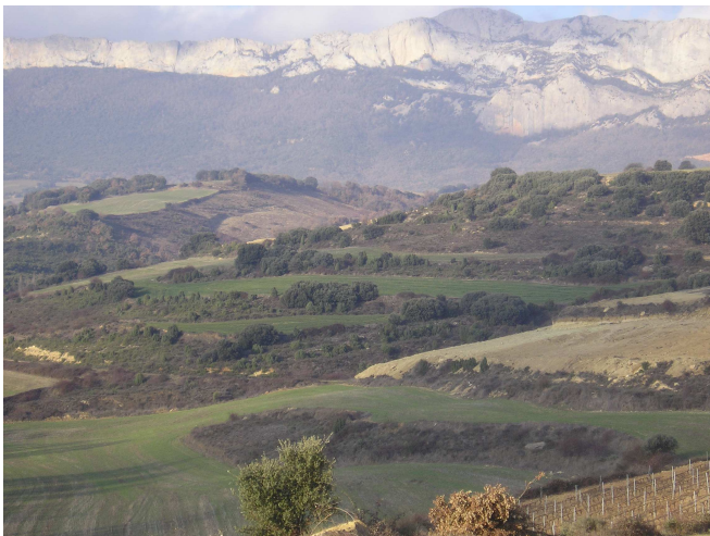
Foto 1. Vista general de la Sierra de Cantabria

En aplicación de las actuaciones propuestas en dicho estudio, desde el año 2007 se están desarrollando los trabajos de selvicultura preventiva en la ladera sur de la Sierra de Cantabria (términos municipales de Labastida, Samaniego, Leza, Laguardia, Kripan y Oyón).