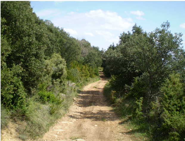
Foto 2. Vista de una futura franja cortafuegos, antes del inicio de las actuaciones