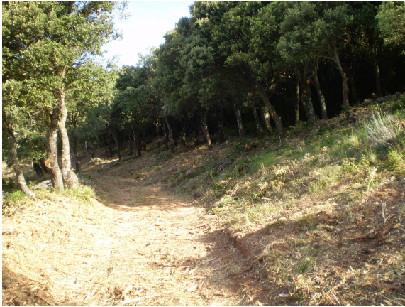
Foto 6. Franja abierta en zona de encinar

Por último, para el mantenimiento de las franjas cortafuegos creadas se va a realizar en 2011 una experiencia piloto con un ganadero de ovino y caprino en la zona este del Monte de Utilidad Pública nº 181 "Monte de Laguardia" de la pertenencia de la Antigua Hermandad de Laguardia. Con los resultados de esta experiencia se pretende extender en años posteriores el mantenimiento a través del aprovechamiento ganadero al resto de las franjas cortafuegos, implicando en la iniciativa al resto de ganaderos. En las franjas en las que por diversos motivos no sea viable el mantenimiento por el ganado (márgenes de carreteras, p.e.) el mantenimiento se realizará por medios mecánicos, actuando sobre el rebrote hasta que sea controlado.