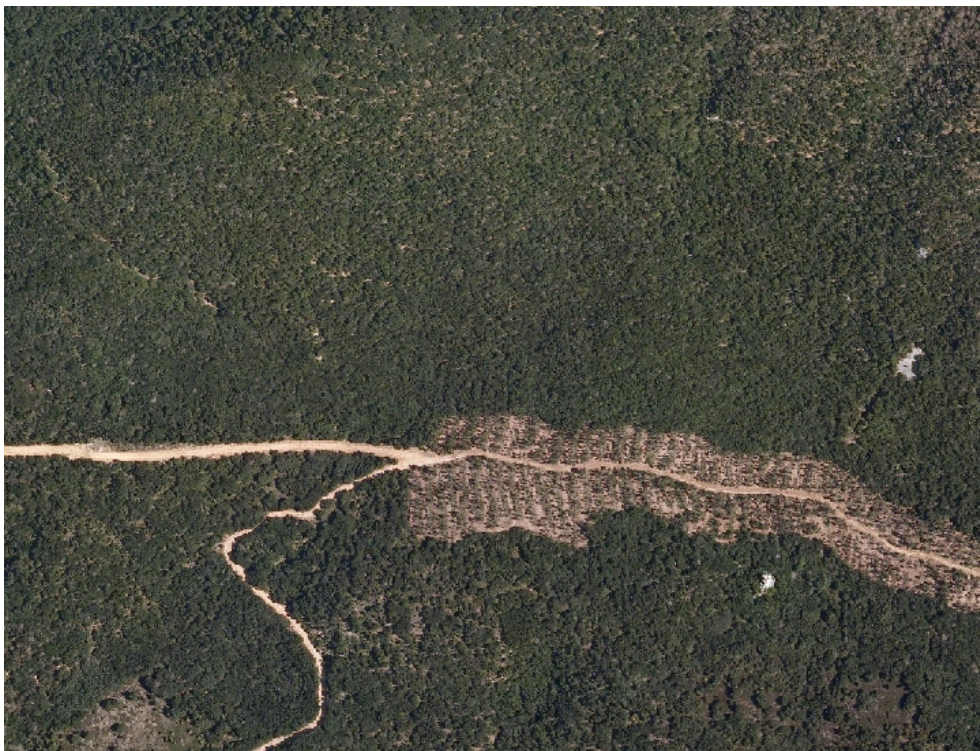
Plano de detalle: Actuaciones en el municipio de Laguardia