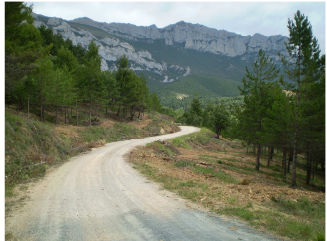
Foto 4. Masas de pinar consorciadas, antes y después de las actuaciones realizadas directamente por el Servicio de Montes