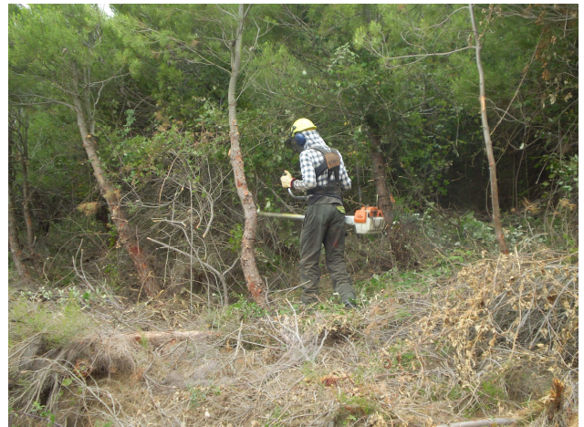
Foto 5. Actuaciones de apertura de franjas cortafuegos