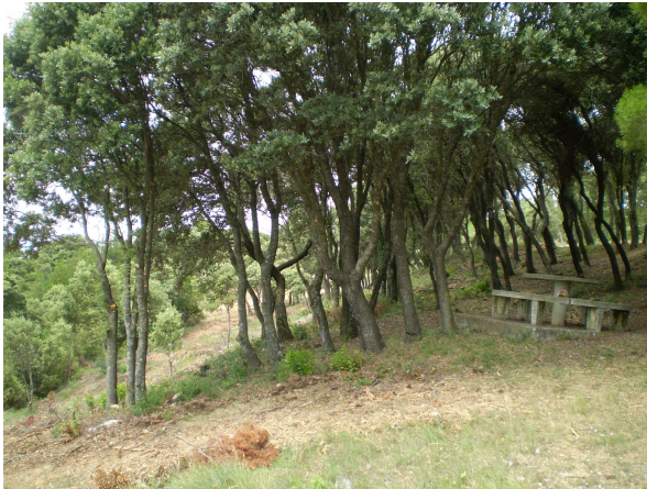
Foto 3. Franja perimetral a un área recreativa, posible foco de incendios

De forma paralela, el Servicio de Montes de la Diputación Foral de Álava se encarga de realizar directamente con cargo a sus presupuestos los trabajos de creación de franjas cortafuegos en aquellas áreas de la Sierra de Cantabria en las que tiene suscritos consorcios de repoblación con las entidades propietarias. En estas zonas consorciadas, reforestadas principalmente con coníferas, el Servicio de Montes se encarga directamente de la gestión y aprovechamiento, sin acogerse al Decreto de Ayudas Forestales.