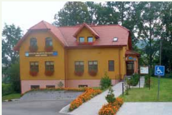
Fot. 5. Centrum Inicjatyw Wiejskich w Ścinawce Górnej