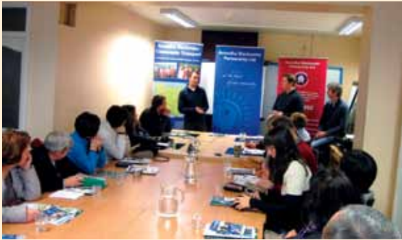
Spotkanie z Grupą Avondhu Blackwater Partnership