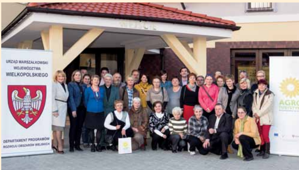
Pamiętkowe zdjęcie uczestników warsztatów "Agroturystyka – współpraca w sieci"

z wielkopolskich gospodarstw agroturystycznych, czego rezultatem jest wydanie publikacji „ Turystyka wiejska w Wielkopolsce. Katalog gospodarstw gościnnych ”. Katalog ten po raz pierwszy tak kompleksowo ilustruje potencjał wielkopolskiej agroturystyki. Prezentuje się w nim