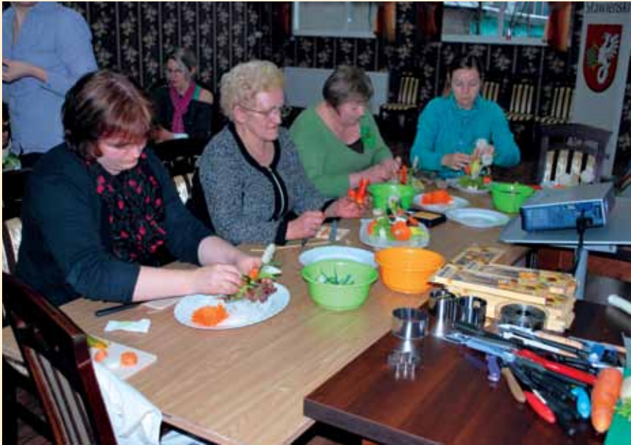
Warsztaty kulinarne pn. Tradycja w nowoczesności