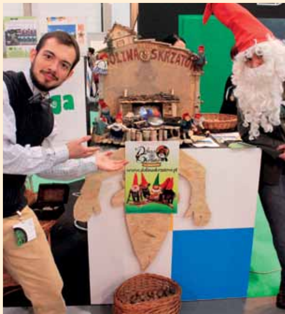
Skrzaty zapraszają wszystkich do swojej Doliny

wiedzieli nas także właściciele najlepszych gospodarstw agroturystycznych w regionie – zwycięzcy konkursu „Złota Grusza”, którzy opowiadali o swoich domach – pełnych uroku i ciepła – oferujących