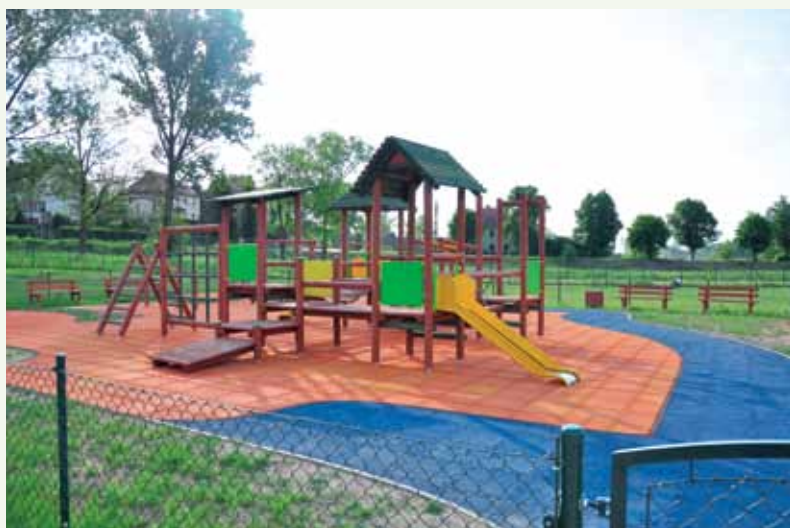
Fot. 12. Plac zabaw