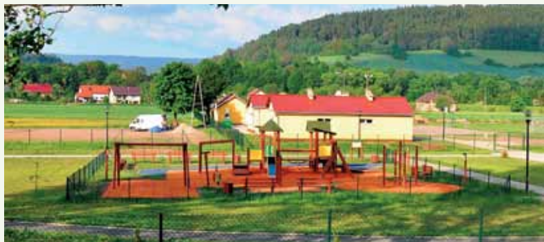
Fot. 11. Kompleks sportowo-rekreacyjny w Ścinawce Średniej