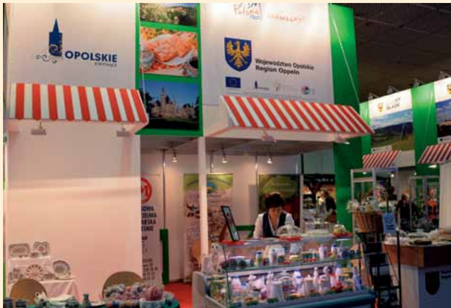
Opolskie podczas ITB w Berlinie

Polskie hasło promocyjne 78. Międzynarodowych Targów Rolno-Spożywczych „Grüne Woche” brzmiało: „Polska smakuje”, a smaki te można było poznać, odwiedzając stoiska polskich regionów. Prezentację województwa opolskiego przygotował Departament Współpracy z Zagranicą i Promocji Regionu UMWO, wspólnie z producentami produktów tradycyjnych z województwa i twórcami ludowymi.