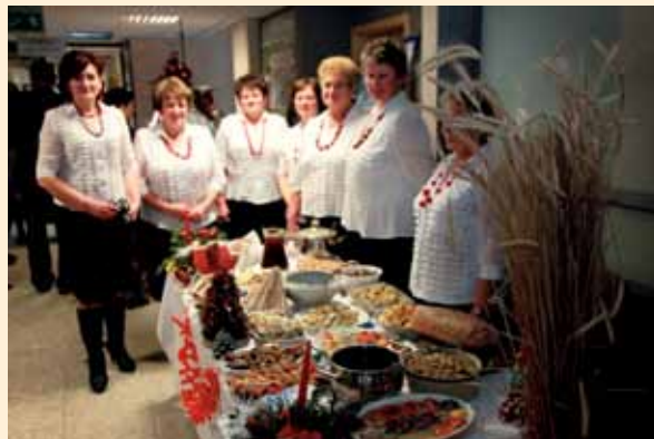
Stół wigilijny prezentowany podczas „Konkursu bożonarodzeniowego”

W kategorii „obrzęd bożonarodzeniowy” spośród nadesłanych filmów wyłoniono 5 zespołów, które w finale zaprezentowały obrzędy bożonarodzeniowe charakterystyczne dla swojego regionu. Tym razem oceniano: scenografię, sposób prezentacji i liczbę zaangażowanych osób, oryginalność prezentacji obrzędu związanego z okresem bożonarodzeniowym, spójność treści, powiązanie z tradycją danego regionu.