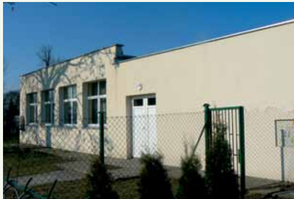
Fot. 8. Świetlica wiejska w Galowicach