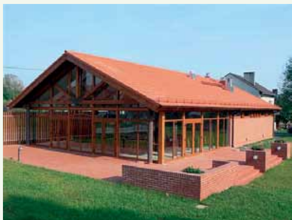
Fot. 7. Świetlica wiejska w Nowojowicach