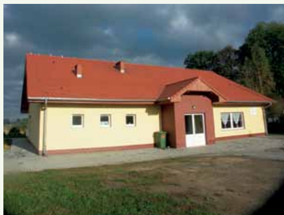
Fot. 3. Sala integracji społecznej we Włókach