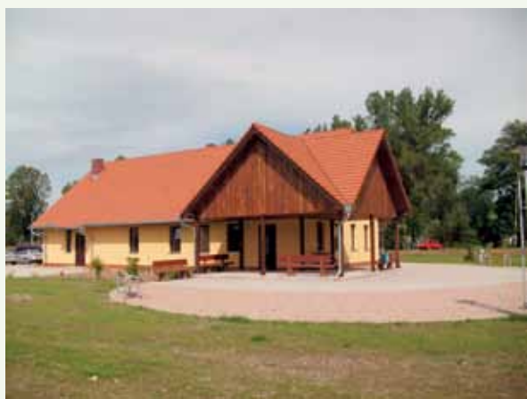
Fot. 6. Centrum Kulturalno-Sportowo-Rekreacyjne w Ratnie Górny