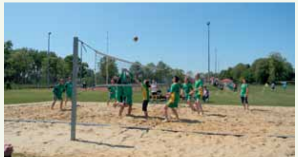
Fot. 10. Międzynarodowa Olimpiada Sportowa Polska–Czechy (integracyjne spotkanie gmin partnerskich)