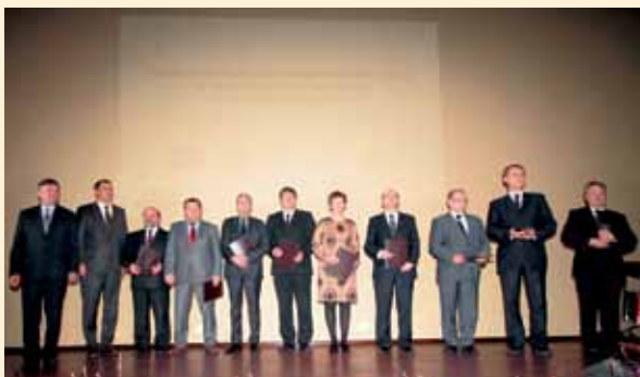
Nagrodzone i wyróżnione gminy podczas gali podsumowującej PROW 2007–2013

Opolskie kwitnące. Katalog gospodarstw agroturystycznych to publikacja skierowana do osób, które cenią wypoczynek w gospodarstwach agroturystycznych i ekologicznych, oferujących nie tylko nocleg, ale również różnorakie formy obcowania z przyrodą, kulturą ludową czy regionalną kuchnią. Katalog przedstawia wykaz ponad 100 gospodarstw agroturystycznych z terenu całego województwa opolskiego, z podziałem na powiaty. Katalog wzbogacono informacjami o walorach turystycznych regionu i możliwościach aktywnego wypoczynku.