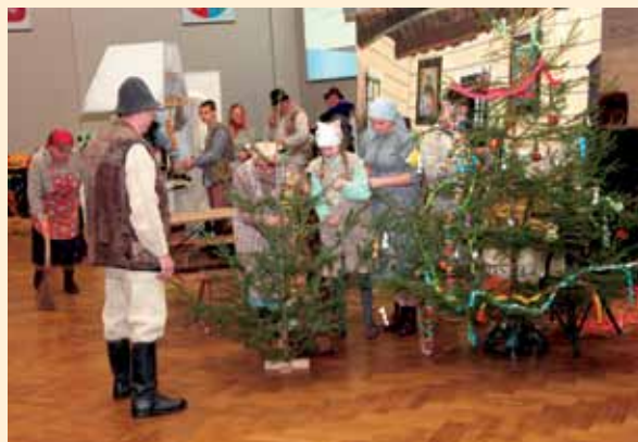
Obrzęd bożonarodzeniowy prezentowany podczas „Konkursu bożonarodzeniowego”

Według oceniających najpiękniejszy obrzęd zaprezentowało: Stowarzyszenie Społeczno-Kulturalne „Soninianie” reprezentujące LGD „Ziemia Łańcucka”, drugie miejsce zajął Zespół Obrzędowy „Strachoczanie” reprezentujący LGD „Dolina Sanu”, trzecie miejsce zdobyło Stowarzyszenie Kultury i Tradycji Ziemi Futomskiej reprezentujące LGD „Lider Dolina Strugu”.