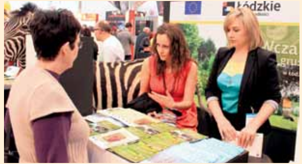
Pracownicy SR KSOW na Targach