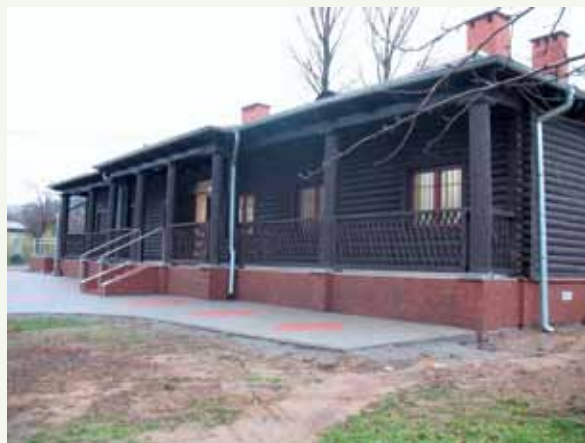
Fot. 4. Domek myśliwski w Jodłowniku