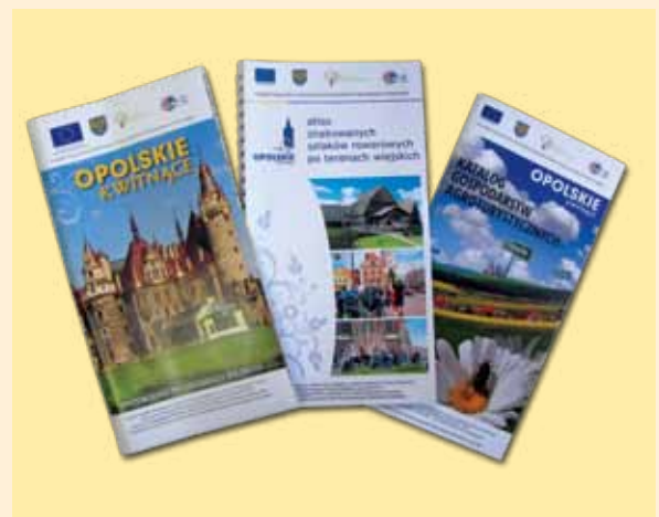
Publikacje z zakresu turystyki wiejskiej Opolszczyzny