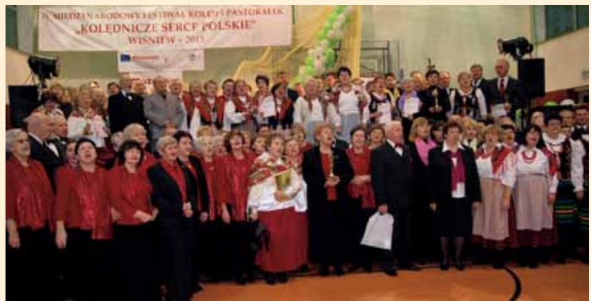
Uczestnicy Międzynarodowego Festiwalu Kołęd i Pastorałek

W Zespole Oświatowym w Śmiarach w gminie Wiśniew (pow. siedlecki) odbył się IV Międzynarodo-