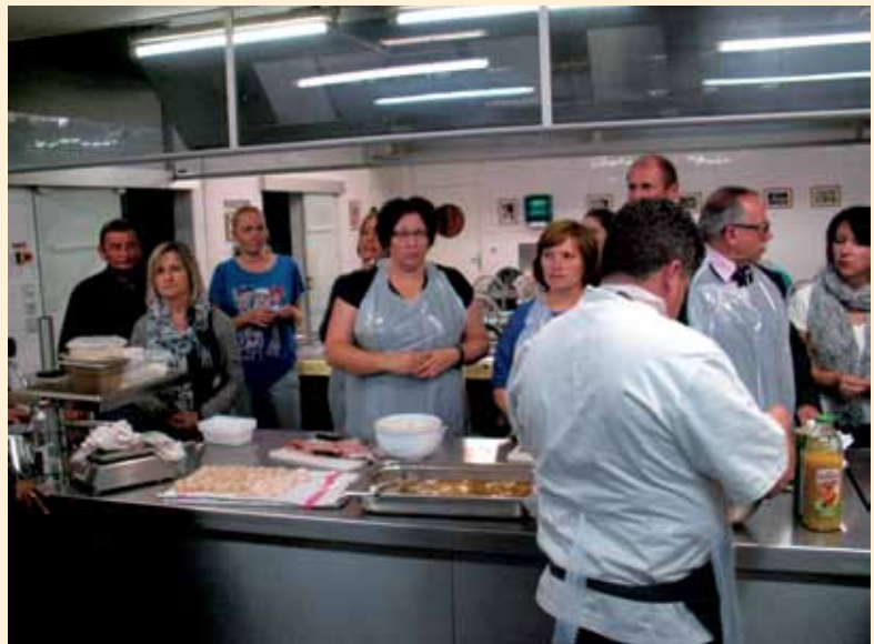
Wizyta studyjna we Francji

W wizycie studyjnej wzięli udział: rolnicy i producenci rolni, osoby działające w sektorze rolno-przemysłowym i turystyce wiejskiej, wytwórcy rękodzieła i artyści lokalni, członkowie organizacji i stowarzyszeń zaangażowanych w rozwój obszarów wiejskich oraz popularyzujących ideę produktów lokalnych jako istotnego elementu wspierania turystyki wiejskiej, a także przedstawiciele Stowarzyszenia LGD