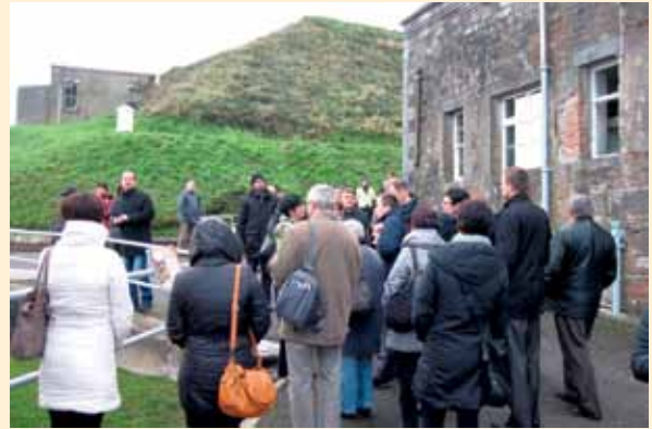
Zwiedzanie Fortu Camden

staniem dziedzictwa kulturowego, historycznego i przyrodniczego, takie jak Fort Camden, zamek Glanworth i muzeum Titanica w Cobh.