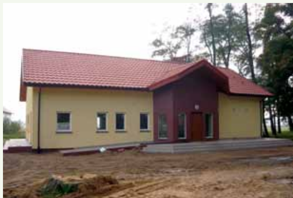
Fot. 1. Świetlica wiejska w Koźlicach

Jednym z obiektów użyteczności publicznej, które często pojawiają się jako zadanie priorytetowe, w programach odnowy wsi, są świetlice wiejskie. Są to obiekty prowadzące działalność kulturalną i edukacyjną na rzecz społeczności lokalnej; mogą także funkcjonować, jako placówki wsparcia dziennego, a także przyjmować inne funkcje w zależności od potrzeb i prowadzonej w tym zakresie polityki społecznej gminy. Takie świetlice funkcjonują w gminie Gaworzyce 13 . Jedną z nich jest świetlica wiejska w Koźlicach (fot. 1, fot. 2).