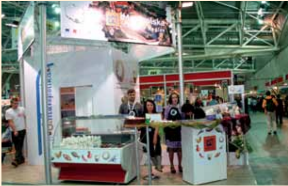
Małopolska na targach w Turynie