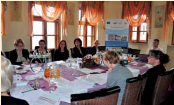
Członkowie Wojewódzkiej Grupy Roboczej w trakcie obrad