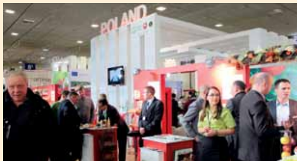
Targi Fruit Logistica