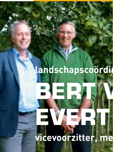
landschapscöördinator ANV Lingestreek