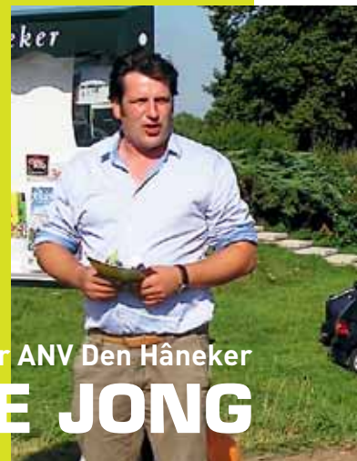
voorzitter ANV Den Hâneker