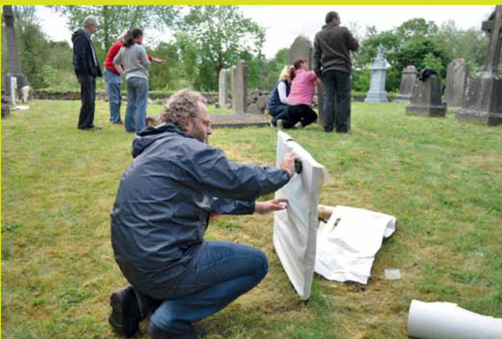
Vrijwilligers brachten de kerkhoven voor de archeologische dienst in kaart. Ze maakten een plattegrond, fotografeerden grafstenen en brachten de tekst met behulp van rubbing over op ‘overtrekpapier’.