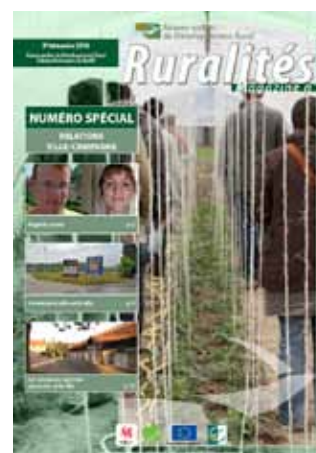
Relations ville - campagne - Sept. 2010