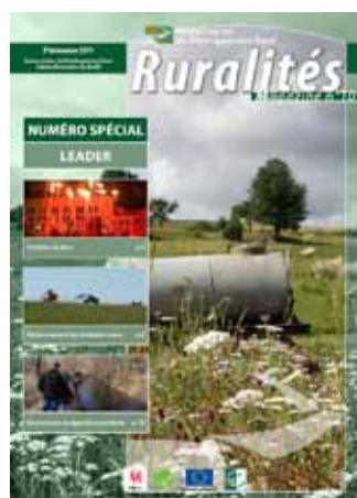
LEADER - Juin 2011