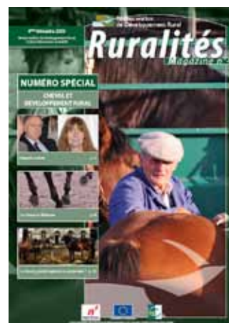
Cheval et développement rural - Décembre 2009