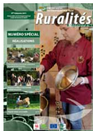
Réalisations - Décembre 2011