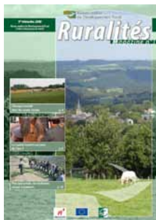
Présentation générale du Réseau - Mars 2009