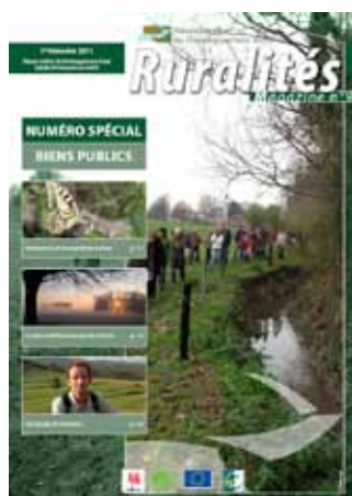
Biens publics - Mars 2011