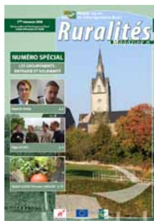
Groupements : entraide et solidarité - Sept. 2009