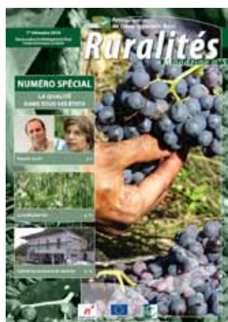
La qualité dans tous ses états - Mars 2010