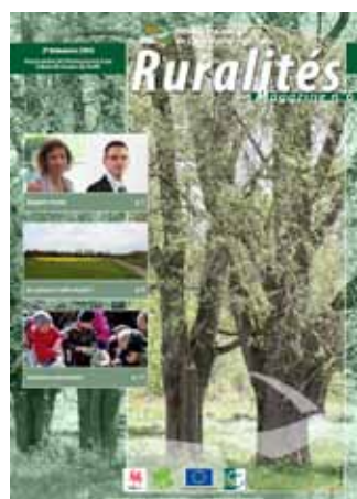
Point sur les groupes de travail - Juin 2010