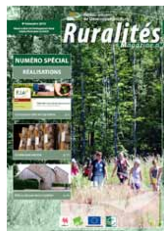
Réalisations - Décembre 2010