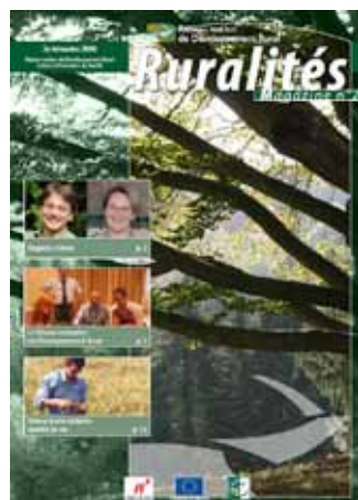
Présentation générale du Réseau - Juin 2009