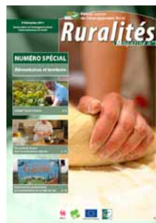
Alimentation et territoire - Sept. 2011