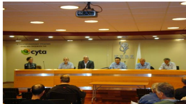
Στιγμιότυπο από την ενημέρωση για το ΕΑΔ στη συνέλευση του Παγκύπριου συνδέσμου

Η ενημέρωση πραγματοποιήθηκε στις 3 Νοεμβρίου 2009 στα γραφεία του Κυπριακού Εμπορικού και Βιομηχανικού Επιμελητηρίου στη Λευκωσία.