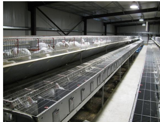
Καινοτόμες αγροτικές εκμεταλλεύσεις στην Κύπρο.