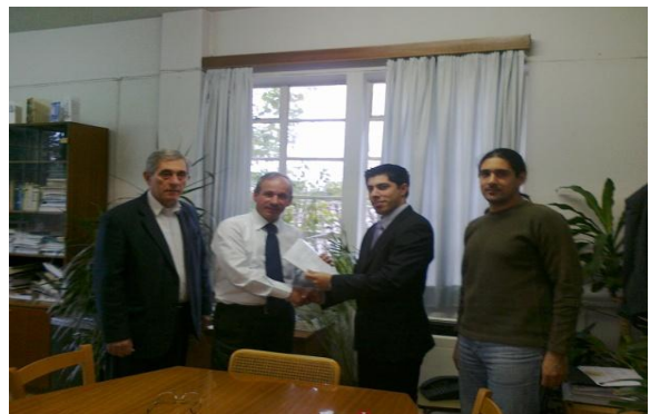
Στιγμιότυπο από την υπογραφή του συμβολαίου μεταξύ του Τμήματος Γεωργίας και Ανάδοχου Εταιρίας

Μετά από ζήτηση προσφορών, υποβλήθηκαν προτάσεις και μετά την αξιολόγηση τους ανατέθηκε το έργο της ετοιμασίας και εγκατάστασης στην Ανάδοχο Εταιρία.