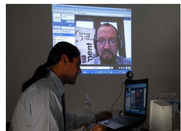
Στιγμιότυπα από Εγκαίνια ΕΑΔ