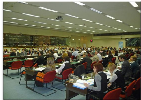
Στιγμιότυπα από συνεδριάσεις της Συντονιστικής Επιτροπής του Ευρωπαϊκού Δικτύου για την Αγροτική Ανάπτυξη