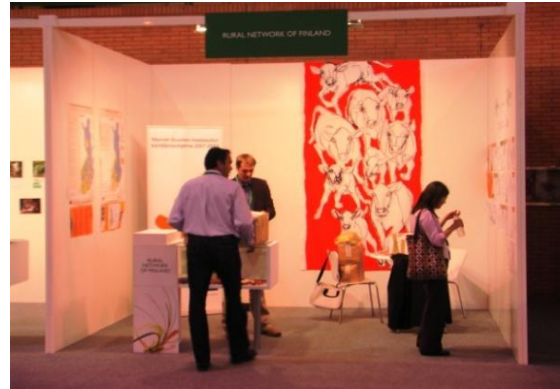
Στιγμιότυπα από συναντήσεις Εθνικών Αγροτικών Δικτύων

Το ΕΑΔ συμμετέχει και στις επιτροπές του Ευρωπαϊκού Δικτύου για την Αγροτική Ανάπτυξη. Στη Συντονιστική Επιτροπή του Ευρωπαϊκού Δικτύου για την Αγροτική Ανάπτυξη και στην Υπό- Επιτροπή Leader.