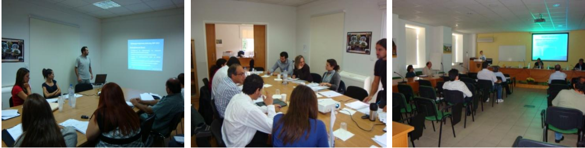
Στιγμιότυπα από συναντήσεις Θεματικών Δικτυακών Ομάδων

Κατά τη συνάντηση οι Εταίροι του ΕΑΔ είχαν την ευκαιρία να ενημερωθούν για τις ενέργειες που πραγματοποιήθηκαν για την εγκαθίδρυση και λειτουργία του Δικτύου και να εκλέξουν τον αντιπρόσωπο που θα τους εκπροσωπεί στη Συντονιστική Επιτροπή.