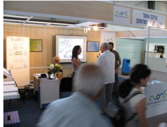
Περίπτερο ΕΑΔ στην 16 η Παγκύπρια Αγροτική Έκθεση