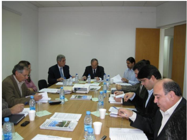
Συνάντηση Συντονιστικής Επιτροπής

Κύριες αρμοδιότητες της Συντονιστικής Επιτροπής είναι η εξέταση όλων των αιτημάτων ή προτάσεων που κατατίθενται από τις Θεματικές Δικτυακές Ομάδες, από την Ολομέλεια ή από τις ad - hoc Επιτροπές, να εγκρίνει τα Ετήσια Προγράμματα Δράσης, τους Ετήσιους Προϋπολογισμούς και τις Ετήσιες Εκθέσεις του ΕΑΔ. Έχει επίσης την ευθύνη να συνεργάζεται με την Ομάδα Διαχείρισης και Λειτουργίας του ΕΑΔ για την αποτελεσματική λειτουργία του Δικτύου.