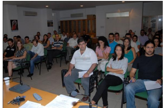
Στιγμιότυπα από την ενδοϋπηρεσιακή συγκέντρωση